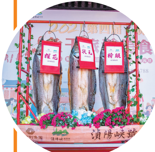
在慈善拍卖活动中拍出天价的三条鱼干

晒鱼干，是北江疍家人的传统手艺。在本次活动期间所进行的鱼干王慈善拍卖中，“状元”北江鱼干王拍出68000元天价，创下历史新高。而“榜眼”“探花”两条鱼干也分别拍出33800元和24800元，拍卖中所筹集的善款将全部对口帮扶贫困户。