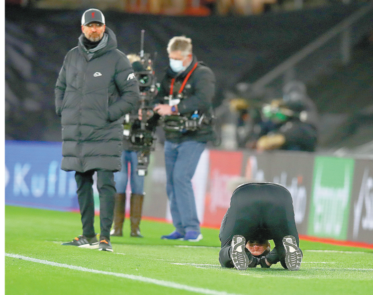
哈帅赢球跪地而泣，克帅输球一脸茫然