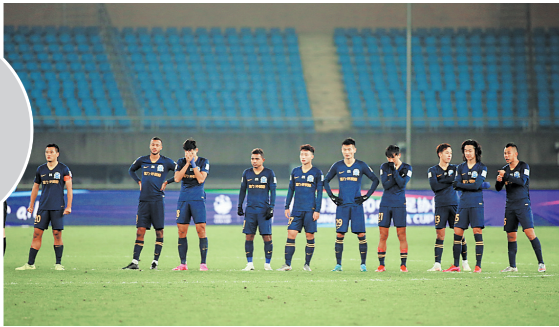
广州富力面临重建

上赛季结束后，广州富力队中发生较大变动，先是主教练范隆克雷斯因为家庭原因请辞，其后雷纳尔迪尼奥、托西奇合同到期，阿德里安、日夫科维奇和李松益、陈哲超等均完成了短期租借合同，先后离队。目前球队只剩下登贝莱一名外援，他的合同将在2022年到满，失去一半首发阵容的广州富力急需重建。