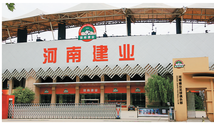
“河南建业”一名或将成为历史

新年伊始，中超就出现了一次不小的震动。河南建业俱乐部突然宣布将在新赛季更名为洛阳龙门，此举令建业球迷非常不满。随后建业球迷更是以各种方式表达不满，试图阻止这次更名，发泄自己内心的情绪。随着中国足协“俱乐部中性化更名”新政的颁布执行，广州恒大更名为“广州队”，广州富力更名为“广州城”，大多说俱乐部的更名都没有激起什么浪花，为什么河南建业的更名却引发巨大争议？