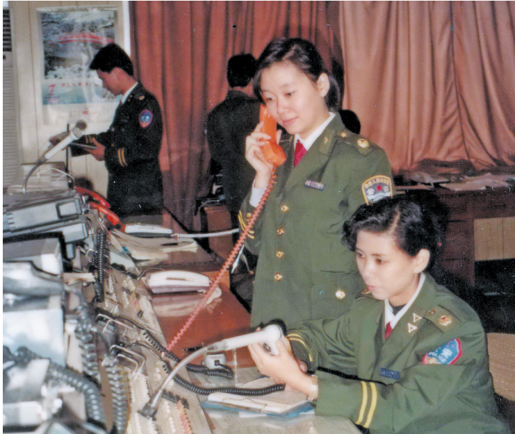
上世纪80年代的广州市公安局110报警服务台(资料图)

嫌疑人28.2万名,救助危难群众41.4万人。到如今,“广州110”近200人的接线员队伍,日接警量