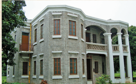
上世纪60年代广东省委领导到洲心调研蹲点时入住的连耕园

在广东探索农业生产责任制的过程中,清远县洲心公社实行产量责任制的做法。当时,洲心公社党委决定首先在百嘉大队搞试点,百嘉大队又决定先在四街生产队搞试点,试点成功后再推广。1959年开始试点后,1960年绝大多数大队都搞起来了,1961年全社铺开。1961年早造开始实行“田间管理到户”的生产责任制,虽然凭工计分,但还未解决群众的积极性,原因是农民的劳动没有直接和报酬挂钩。1961年晚造,洲心公社部分生产队进一步改进生产责任制,在“田间管理到户”的基础上,制订了落后田产量指标,规定每个社员对自己所管地段都有产量责任,超产奖励,只奖不罚,将产量和劳动报酬结合起来,大大提升了群众的积极性和创造性。到1962年早造,洲心公社所有大队都采用了这种办法,并逐