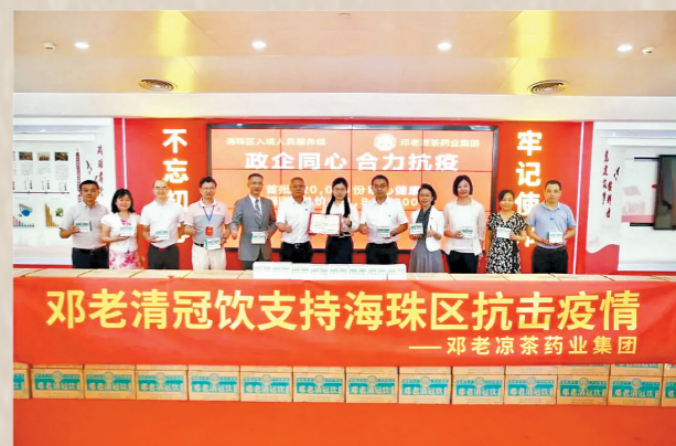
价值超6000万元的邓老清冠饮等产品助力海内外抗疫