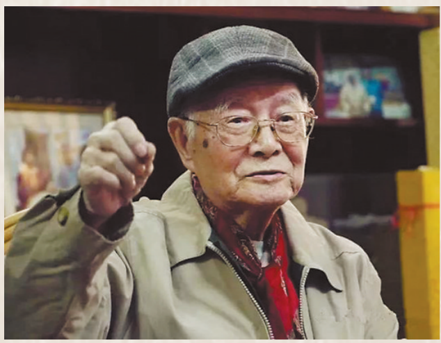
一代国医大师邓铁涛教授