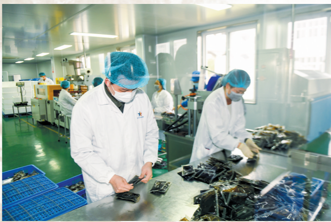
忙碌的邓老药业生产车间

在长达80余年的医疗教学科研生涯中,邓老融古贯今,积累了丰富的临床经验,继承与创新中医理论学说,并提出系列发展中医学战略;他一生致力于我国中医药事业的发展,从医80余载济世为民、仁心仁术培育中医接班人,春风化雨,润物无声,对我国发展中医药事业作出了重大的贡献。“为中医而生的人”,实至名归。