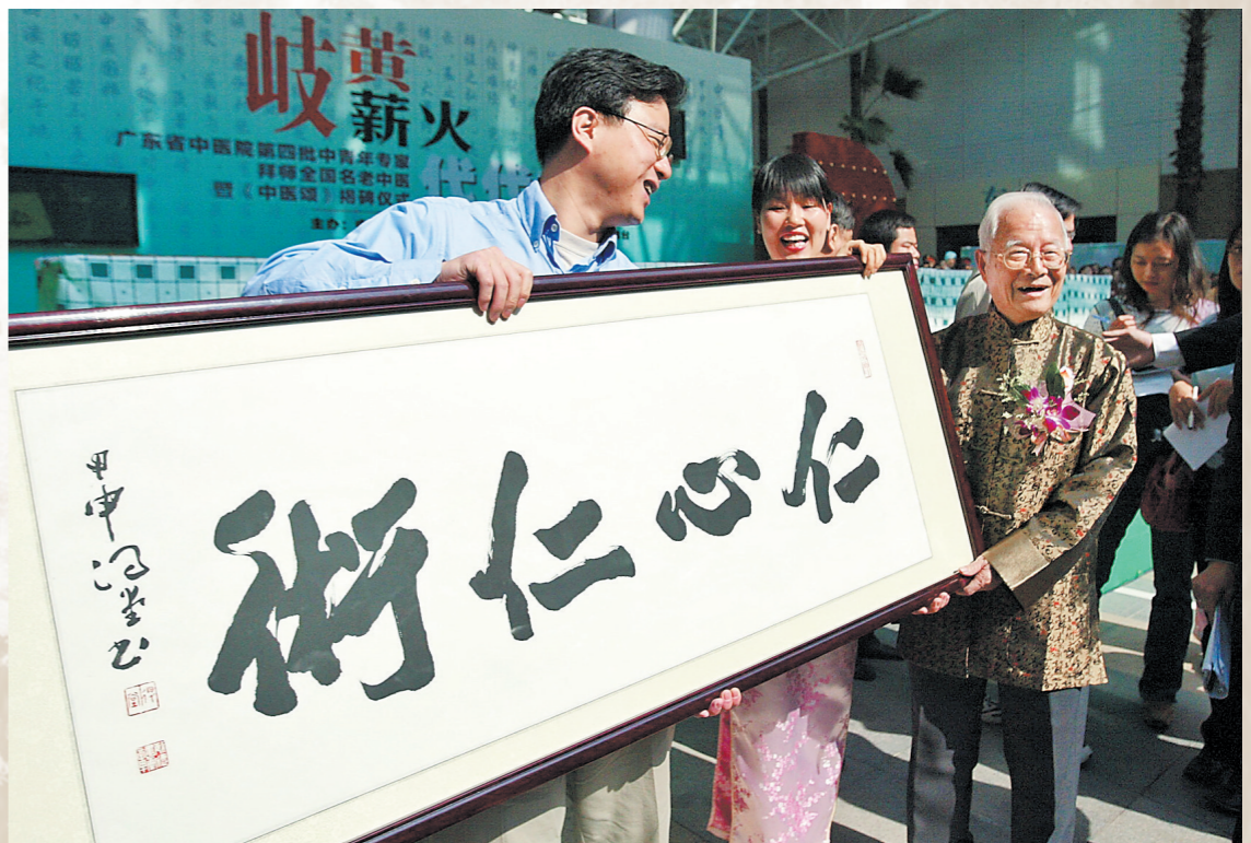
2004年,国医大师邓铁涛收徒现场

中医的传承发展,需要大家的共同努力。邓老虽已离开,但他留下了久经考验的中医瑰宝,这是留给全人类的精神财富,取之不尽、用之不竭。