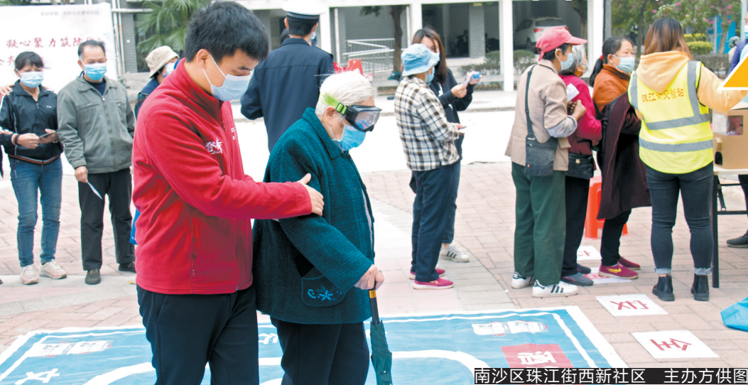
南沙区珠江街西新社区