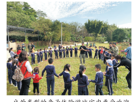
户外类型的亲子体验游比室内更受欢迎

童董:就今年寒假来说,受疫情影响,目前人们都在观望,选择比较谨慎,基本上会以广州周边及市内的产品为主。