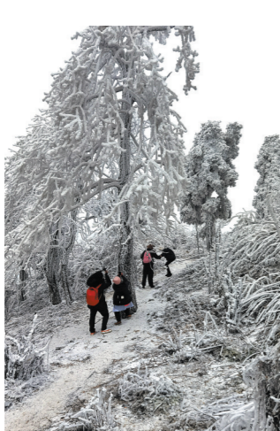
寒潮下南方高山成冰雪世界

不过需要提醒的是,想在广东周边看到冰雪,首先要选择较高的山岳景区,留意天气预报下雪或出现雾凇的时间,及时出发。