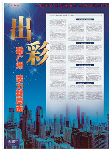
羊城晚报获奖作品

羊城晚报讯 记者张豪、罗仕报道:17日下午,2020广州十大新闻在穗发布。此次评选活动由环球网与广州市记协共同主办,共评选出100个2020广州十大新闻及系列新闻传播案例、广州“老城市新活力”十大魅力影像及传播案例,其中羊城晚报共12件作品入选。