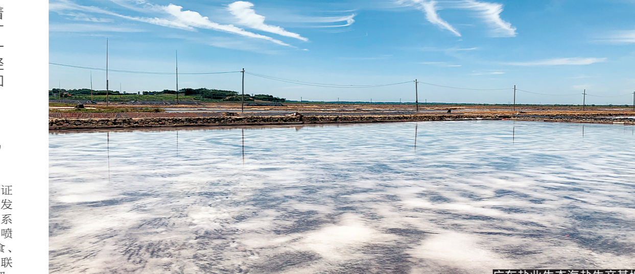
广东盐业生态海盐生产基地

改革永远在路上，改革之路无坦途。广东盐业作为国家发改委第三批混改试点和省属国企首家公司列入广东省工业和信息领域电子商务第三批试点单位。