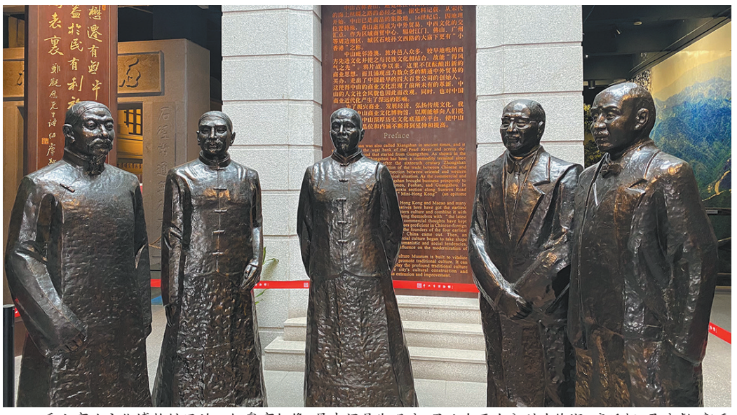
香山商业文化博物馆里的一组粤商铜像,最中间是郑观应,另从左至右分别为徐润、唐廷枢、马应彪、郭乐

家乡。 又36年之后的1878年,13岁的孙中山在兄长孙眉的安排下,在雍陌村民郑载林家住了一些时日,后随郑载林一起乘长行渡至澳门,转大轮船再去檀香山。 近代的香山统辖今天的中山、珠海、澳门三地,其人杰荟萃、商旅纵横由此可见。