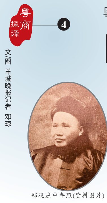
郑观应中年照(资料图片)