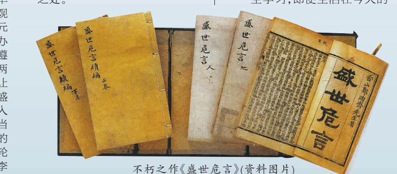
不朽之作《盛世危言》(资料图片)

互联网时代,这也是很难想象的。 从郑观应的众多诗文可知,他的传统学问功底相当扎实,不但熟读四书五经,且时常引用二十四史以及汉唐至明清诸名家的著作,并深受儒家“忠君爱国”思想的浸染,这可能是他超越一般商人群体,进而能与当时的高级官僚及知识分子平等沟通的基础。 更重要的是,郑观应留意汲取西学不停顿。江南制造局翻译馆、京师同文馆新译的西书,《万国公报》《上海新报》《申报》等刊载的新学知识,无论是工程制造还是社会科学、医学等,他都有所涉猎。 郑观应爱向懂西学的人请教,例如专门就人体特异功能的事写信给伍廷芳,