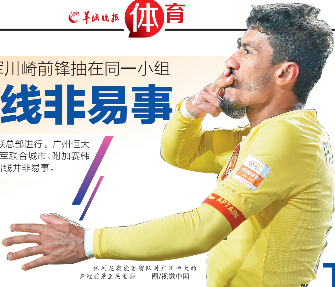
保利尼奥能否留队对广州恒大的亚冠前景至关重要 图/视觉中国