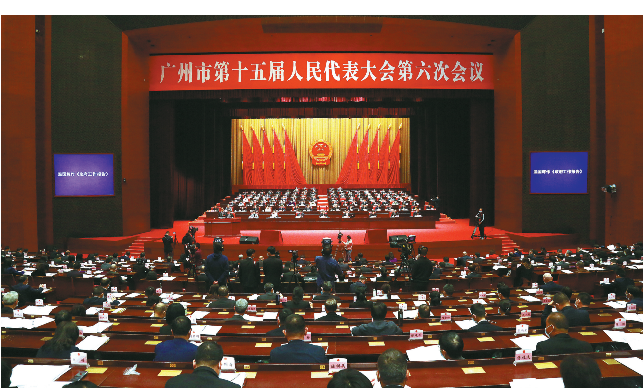
广州市第十五届人民代表大会第六次会议于今日上午开幕

市经济社会发展的主要目标是:实现老城市新活力,推动综合城市功能、城市文化综合实力、现代服务业、现代化国际化营商环境出新出彩取得决定性重大成果,国家中心城市和综合性门户城市建设上新水平,国际商贸中心、综合交通枢纽、科技教育文化医疗中心功能大幅增强,省会城市、产业发展、科技创新和宜居环境功能全面强化,城市发展能级和核心竞争力显著提升,粤港澳大湾区区域发展核心引擎作用充分彰显,枢纽之城、创新之城、智慧之城、品质之城更加令人向往。 2021年是具有特殊重要性的一年,做好今年工作意义重大。报告指出,今年经济社会发展的主要预期目标是:地区生产总值增长6%以上,其中工业增加值增长5.5%;地方一般公共预算收入增长4%;城镇登记失业率控制在3.5%以内;居民消费价格涨幅控制在3%左右;固定资产投资增长8%,社会消费品零售总额增长7%,外贸进出口总额增长1.5%;城乡居民收入增长与经济增长基本同步;节能减排约束性指标完成省下达的年度任务;经济金融风险有效防范。 报告提出,为实现上述目标,广州市要强化科技创新支撑能力,实施产业链供应链提升工程,服务构建新发展格局,实行更高水平改革开放,推进“双区”建设、“双城”联动,提升城市功能品质,强化乡村振兴示范表率作用,改善人民生活品质,加快城市治理体系和治理能力现代化,努力建设人民满意的服务型政府。