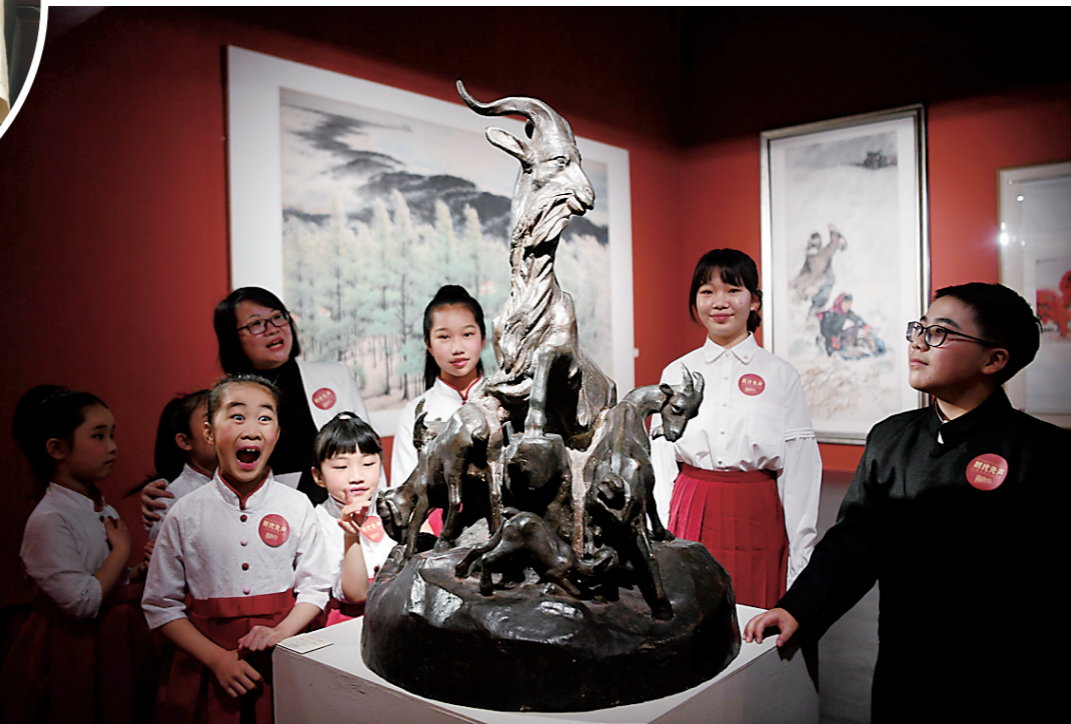
大展现场

李鹏程:对,甚至有人因此说“北有‘狂人’,南有‘超人’”;杨匏安、朱执信的新诗,当代诗人也未必能及。梁启超的《少年中国说》影响了一