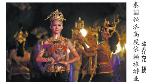
泰国经济高度依赖旅游业

1月28日消息,据外媒报道,泰国近日正在考虑全面开放国门,对已完成新冠疫苗接种的游客可免除强制隔离的要求。通过这项名为《欢迎再次回到泰国》的计划方案,当局希望到今年第二季度看到更多旅客回到泰国的旅游目的地。按照这项计划,旅客需要提交已完成两次新冠疫苗接种的证明,并符合常规的签证要求。如果这项计划最终落地,泰国将成为首个实现旅游业全面开放的亚洲国家。