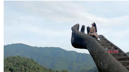
清远古龙峡森林王国

据悉,目前已有南海西樵山、清远洞天仙境、广州宝墨园、南粤苑、清远千年瑶寨、江门古兜温泉、河源客天下、台山那琴半岛等多家景区报名参加活动。