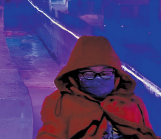
正佳海洋极地世界冰雪乐园

据悉,近期,各种富有地方特色的“年货礼盒”成为各大旅行平台上一道别样的“春节大促”板块,如,驴妈妈旗下伴