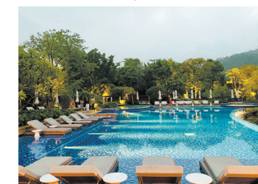
周边酒店度假成为主流选择