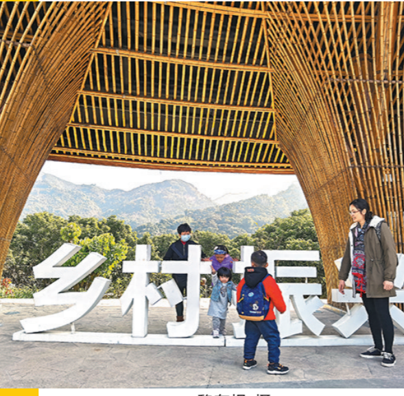
从化南平静修小镇

当前疫情防控形势严峻复杂,为减少大规模的人员流动,全国各地倡议春节不返乡。春节期间留粤过年,正好可以驻足欣赏悠悠岭南文化和广东省内众多美丽景致。日前,广东省文化和旅游厅分别公布了第二批广东省乡村旅游精品线路、第二批广东省文化和旅游特色小镇名单、第二批广东省旅游风情小镇名单,让大家留粤过年、体验周边旅游有了更多选择指引。