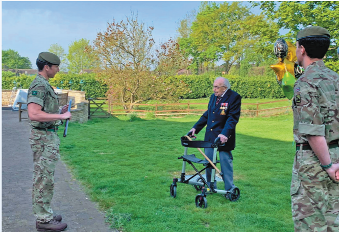
▲2020年4月16日,穆尔在英国贝德福德郡走完最后一圈后与士兵交谈

穆尔是英国中部贝德福德郡一名二战老兵。他于2020年4月发起步行筹款挑战,目标是在4月30日百岁生日前借助助行器绕自家院子走100圈,为抗疫医护人员筹集捐款1000英镑。他的善举激励和感动了无数人,世界各地民众纷纷慷慨解囊,最终为英国国民保健制度筹集超过3200万英镑,穆尔也因此创下个人通过步行筹款最多的吉尼斯世界纪录。