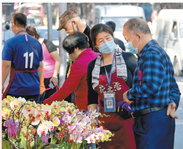
市民挑选年花