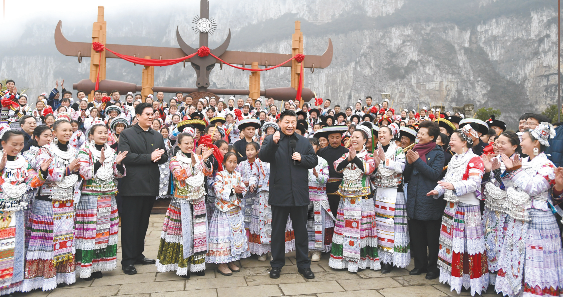
2月3日至5日，中共中央总书记、国家主席、中央军委主席习近平来到贵州考察调研，看望慰问各族干部群众，向全国各族人民致以美好的新春祝福。这是3日下午，习近平在毕节市黔西县新仁苗族乡化屋村文化广场上，向全国各族人民、港澳台同胞和海外侨胞拜年

“我们这次火星探测任务最核心、最艰难的地方，就是探测器进入火星大气后气动外形和降落伞减速的过程，只有一次机会。”中国航天科技集团五院火星探测器总设计师孙泽洲表示，研制团队做了充分的准备，专门设计了全新气动外形、新型降落伞等等，希望一切顺利。