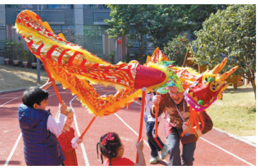
外籍师生体验舞龙

羊城晚报讯 记者崔文灿、实习生刘锦鹏报道：“就地过年”的在穗外籍师生也能尽享中华传统“年味”。5日，记者走访广州医科大学和广州贝赛思外籍人员子女学校获悉，广州市教育系统和校方按照一视同仁无差别原则，积极做好“就地过年”外籍师生的服务保障工作，让他们在穗度过欢乐祥和、健康安全的中国年。