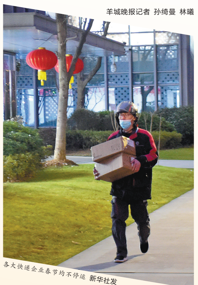
羊城晚报记者 孙琦曼 林曦 各大快递企业春节均不停运

如，申通快递表示，发往上海、广州、深圳、杭州、南京地区的票件额外另加派费0.5元/票。而发往非上述目的地的快件，将严格按照申通官方公布价收费。“详细价格需咨询当地网点，且不承诺发货时效。”顺丰则表示，1月22日至2月10日期间，对重货包裹、标准零担以及大于(含)20kg的标快产品，部分陆运线路收取不低于0.5元的资源调节费；2月11日至17日春节假期期间，对主要城市互寄服务加收不低于10元的资源调节费。