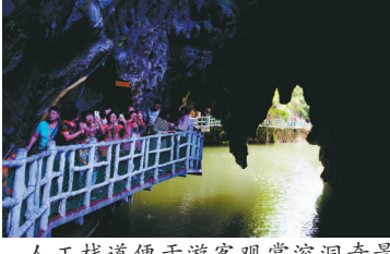
人工栈道便于游客观赏溶洞奇景