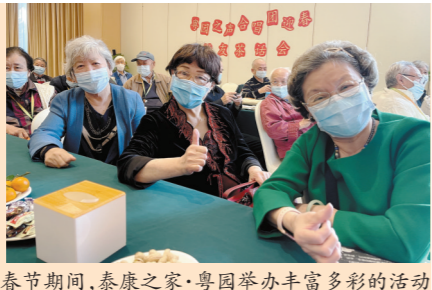
春节期间,泰康之家·粤园举办丰富多彩的活动

1月20日下午,国务院联防联控机制召开新闻发布会。针对近期的新冠肺炎疫情形势,民政部进一步加强了防控措施,提出养老机构进入冬春季防控应急状态,启动封闭管理,暂停探视和必要人员的进入,各类物资进入养老机构要规范消毒和接收管理。新春将至,广州各大养老机构为老人们与亲人的春节“相思之苦”也是各出奇招。