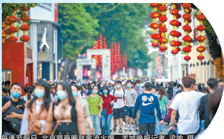
每逢节假日,北京路商圈就客流火爆

8日,《北京路步行街改造提升二期(2021-2022)工作方案》(以下简称《工作方案》)获广州市政府常务会议审议通过。《工作方案》显示,广州计划通过3年时间,开展步行街改造提升二期建设,提升北京路步行街作为广州“广府源地,千年商都”的窗口形象。