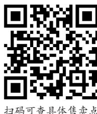
扫码可查具体售卖点

本次展览分“拼接先秦文明”“追寻古城文脉”“探索丧葬文化”三部分,集中展示了2020年广州考古的成果。展览展出的汉代陶器形五联罐、唐三彩执壶、五代南唐青瓷盖(带托),都是广州考古发掘极为罕见的文物珍品。特别是本次发现的唐三彩壶,是广州地区第二次考古发现唐三彩器物,意义重大。广州市文物考古研究院专门向社会各界公开征集对这件唐三彩壶的修复创意方案,欢迎文物和中华优秀传统文化爱好者积极参与。