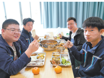
职工吃到的特殊团年饭

自启动“佛山过年·工会有礼”活动以来，佛山市总工会已向全市职工发放600万消费券、11万张景区门票、1万张电影票、1万多副手写春联，举办了100多场佛山年俗体验活动，确保广大职工特别是外来务工人员能在佛山度过一个欢乐祥和、平安健康的春节佳节，体验佛山本土年味。该活动更受到央视《新闻联播》、央视《焦点访谈》、新华网、工人日报等央媒关注。