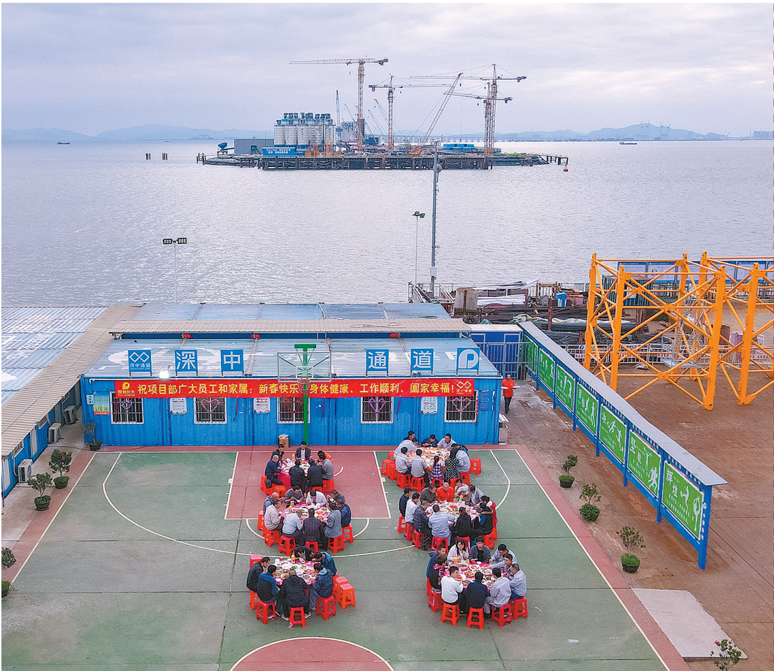
伶仃洋大桥西索塔建设者的“海上年夜饭”

2月11日晚上8:18，除夕夜，正是万家团圆时。绚烂的烟花从建设中的全球最高海中大桥——深中通道伶仃洋大桥的西索塔主墩，与世界上最大的纯海中锚碇——伶仃洋大桥西锚碇上腾空而起，在伶仃洋上绽放。除夕夜的烟花映照在了近200名留守于此“海上过年”的深中通道S05标一线建设者的脸庞，也照在了他们的心里。