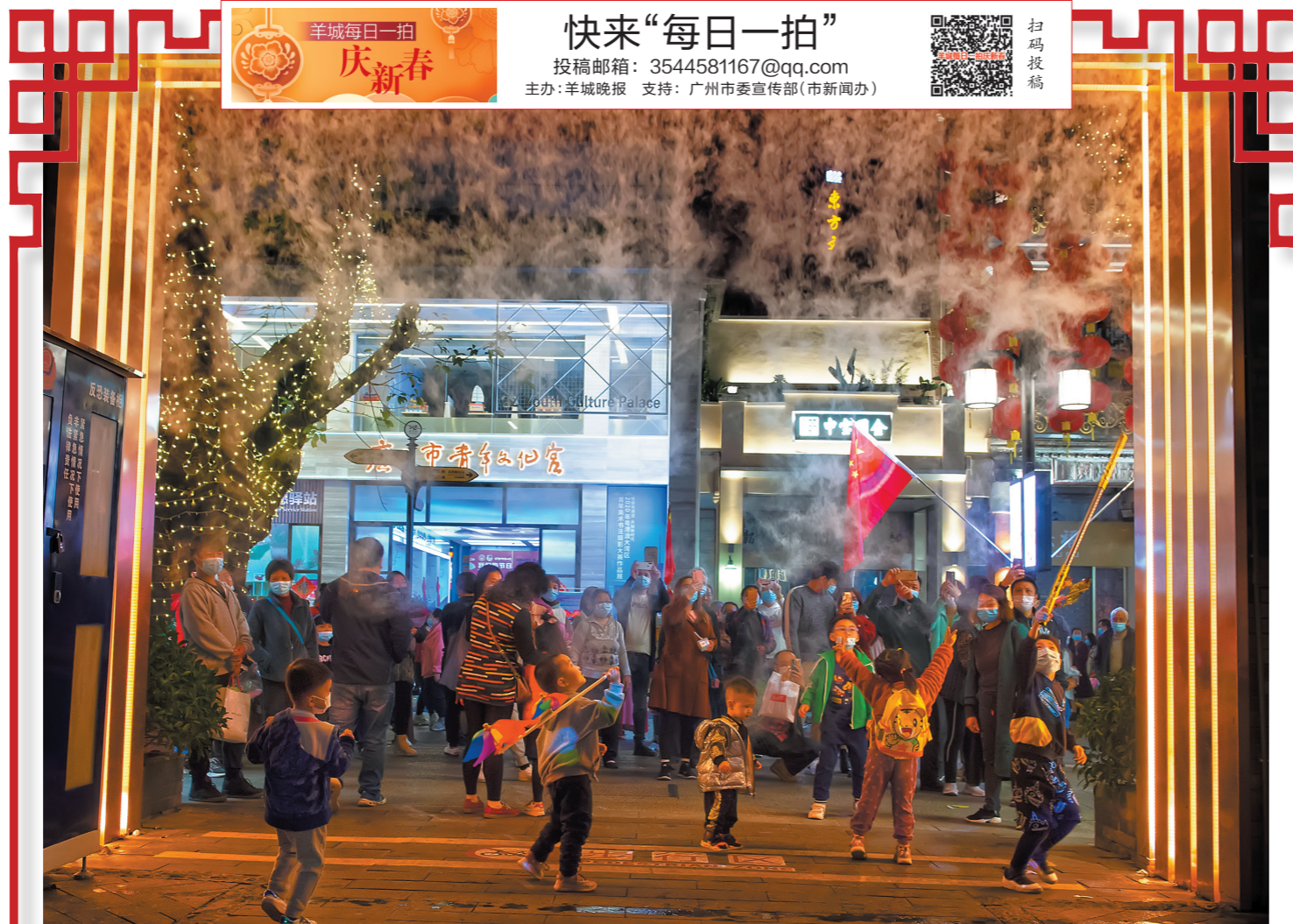
广州市北京路,孩子们在浓浓的节日气氛中开心玩耍

香港电台发言人12日表示,从12日晚开始,将停播BBC(英国广播公司)国际频道及“BBC时事一周”节目。(新华社)