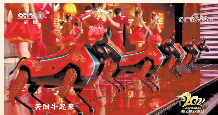
春晚创意表演《牛起来》

羊城晚报讯 记者沈婷婷报道:2月11日,在央视2021牛年春晚的舞台上,深圳优秀科技全新研发的首款大型四足机器人化身“拓荒牛”,与刘德华、王一博、关晓彤等一起呈现了科技感十足的创意表演《牛起来》。它们以拼搏进取的深圳“拓荒牛”为设计原形,融合祥云及中国红等传统元素,以绚丽的灯光及机械结构诠释科技美感,伴随激昂的音乐奔腾向前。