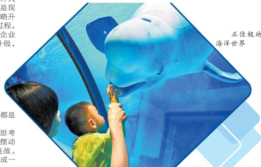
正佳极地海洋世界

羊城晚报记者注意到,“十三五”期间,阳江合金材料产业加速向千亿级产业集群迈进,2020年阳江合金材料产业总产值突破700亿元,成为华南地区重要基础原材料生产基地,世界级风电产业基地加快建设