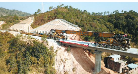
赣深高铁河源段最后一根箱梁架设完成