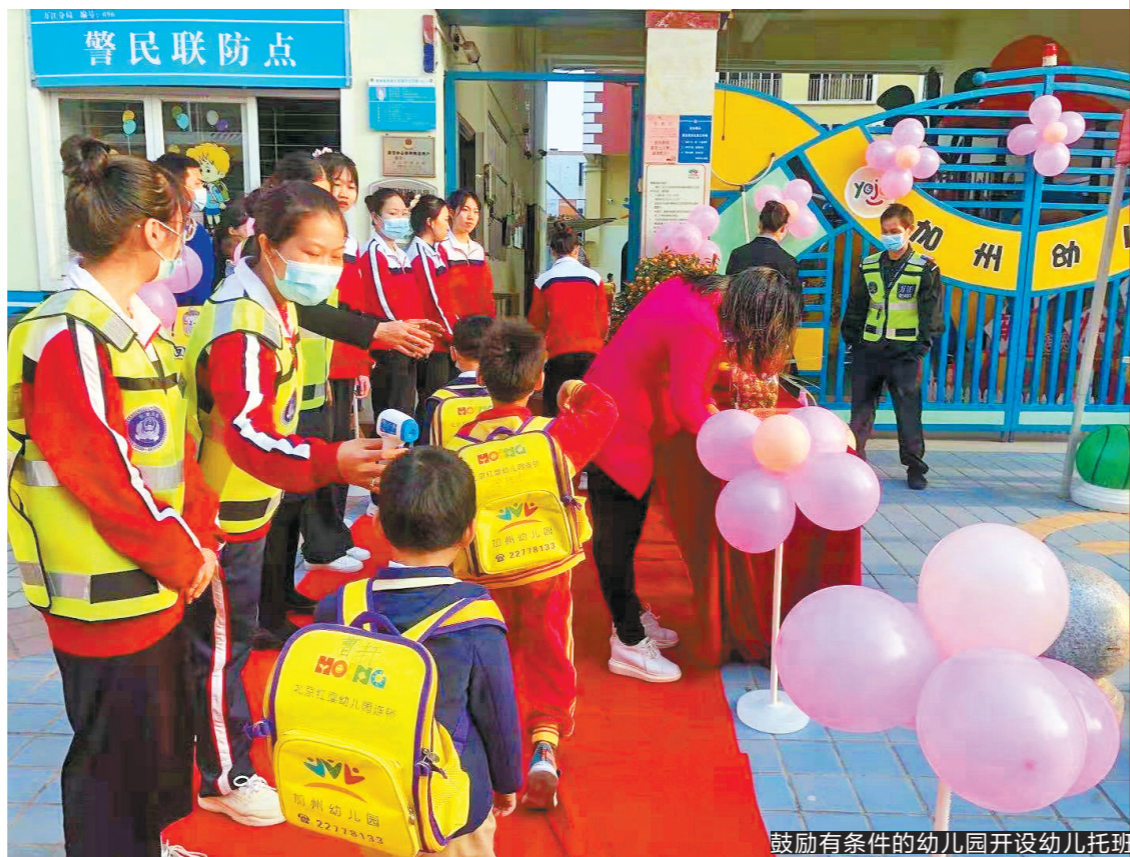
鼓励有条件的幼儿园开设幼儿托班

《方案》提出,探索建立托幼服务一体化新模式,有条件的幼儿园利用现有资源开设幼儿托班,招收2至3岁的幼儿。鼓励新建幼儿园按有关标准设置适当比例的2至3岁幼儿托班。加大对普惠性幼儿园的政策支持力度,鼓励公办和民办幼儿园通过改建、扩建等方式,增加托育资源供给。