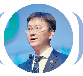
以思考为底,学思之催新;以创新为核,方能做到“人无我有,人有我强”。