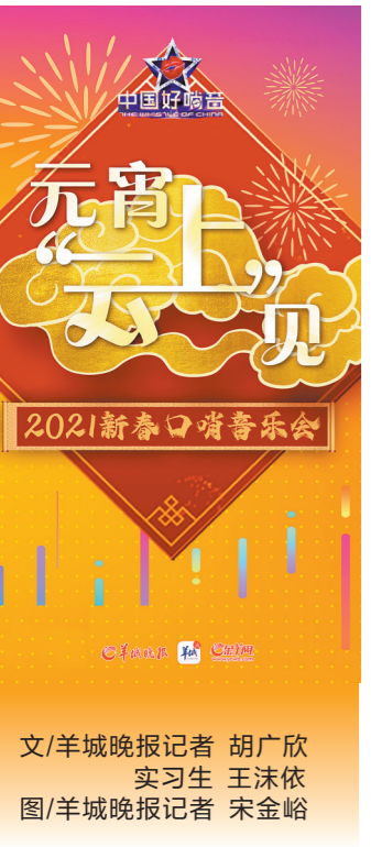
文/羊城晚报记者 胡广欣 实习生 王沫依 图/羊城晚报记者 宋金峪

中国好哨音,元宵“云上”见!明日正月十五,“中国好哨音”以新春口哨音乐会的形式正式宣告回归。本次音乐会首次以线上形式进行,演出嘉宾们准备了多个新颖独特的口哨表演,富有岭南特色的文艺演出,与全国观众共庆元宵。