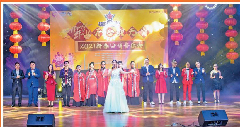
新春口哨音乐会圆满举行

除了本次口哨音乐会之外,大沥分别在正月十一、正月十四举办了盐步龙狮大会和大沥醒狮盛会两场新春线上展演。新春口哨音乐会将于2月26日早上10点准时上线金羊网、羊城派、“南海大沥”微信公众号,观众不仅能看到精彩的表演,还能抢红包:直播期间有随机掉落的“红包雨”,惊喜不断。