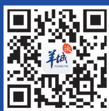
扫描二维码 欣赏更多精彩内容

《又一春》由著名导演艺术家、国家一级导演王佳纳执导,男高音歌唱家于爽与知名编剧王秋月联合编剧。该剧主演阵容由一众老戏骨组成,包括原广州市话剧团演员康路,舞台、影视表演艺术家李卫东,国家一级演员、原广州军区政治部战士话剧团演员曲芬芬、齐亚萍,原广州军区政治部战士话剧团演员于沈源、马冬菊和王志国等。