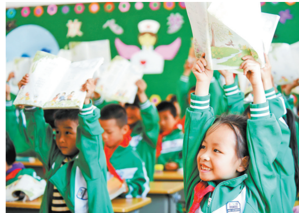
广东广州对口援建的贵州毕节市纳雍天河实验学校里，1260名孩子开心享受校园时光

广东还建立“三大基地”培养致富带头人。2015年，在佛山南海首创粤桂扶贫协作贫困村创业致富带头人培训基地，采取“双培双带双促”培育模式，先后辐射带动扶贫协作四省(区)培训2.9万人，创业成功7384人。去年11月，在清远市连江口镇连樟村碧桂园(“1+1+1”培训模式)和广州市增城区石滩镇幸福田园，新建两个全国贫困村创业致富带头人实训基地，进一步创新了培训模式，完善了培训体系。