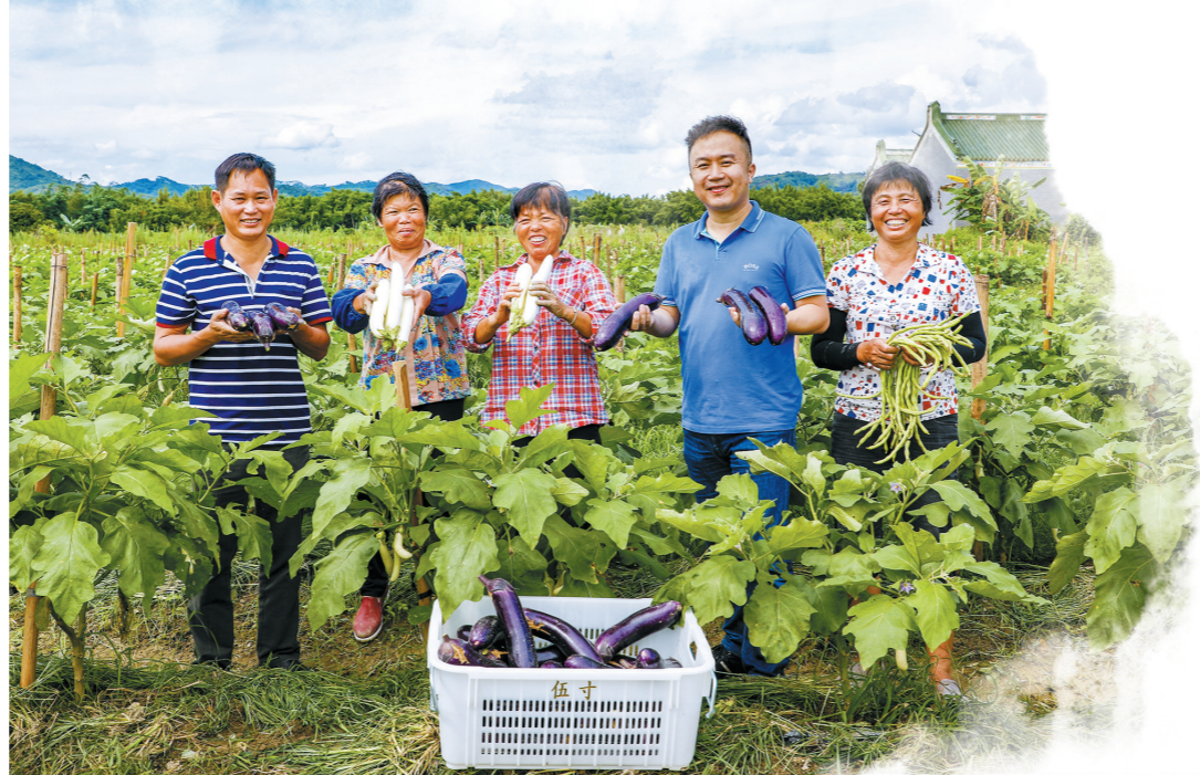
揭阳市揭西县坪上镇供港蔬菜基地项目