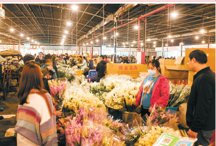
2月10日晚,芳村岭南花卉市场鲜花区,市民通宵购买年花贺新年