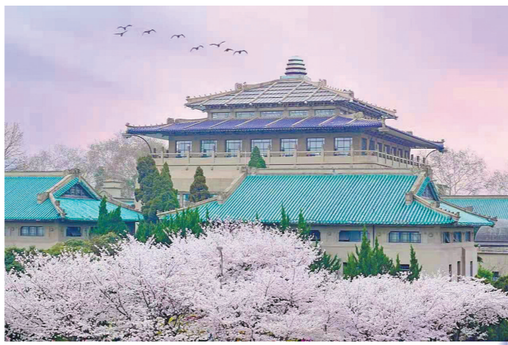
武汉大学往年樱花盛景

解,以此回报曾在抗疫中作出贡献的白衣战士。受到邀请,不少曾逆行前往武汉支援抗疫的医护人员,准备到武汉看看樱花,感受这座自己战斗过的城市,走出疫情阴霾之后的美好。