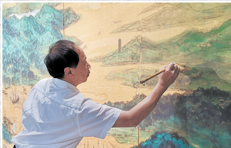
李劲堃肩负弘扬岭南画学的使命,逐渐形成“直面当代、立中研西、以古鉴今”的艺术自觉

遮雨棚,楼上9户人家,因为美院上课时间比较机动,大家从早到晚随时都可能泼水,水自然往下滴,所以好像一天到晚都在听雨。此外,楼上有些小朋友可能也会不注意地丢些纸屑之类的杂物下来,我也以平常心对待,丢下来我就捡走。就是这么一件小事,记者在文章中认为,这显示了我的平和与气度,未来可期。这给我带来非常大的震撼,原来生活中的细枝末节,都可能成为一种修为,这对我日后耐心沉着地做人、做学问带来很大的启发。”