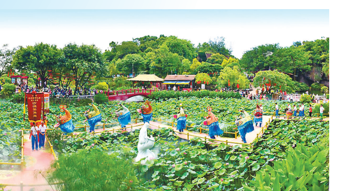
近年来,番禺区文旅深度融合。2020年6月,在莲花山旅游区举行的第34届全国荷花展上,沙涌鳌鱼舞进行展演。

莲花山上桃花争芳斗艳,宝墨园内樱花灿若云霞,海傍水乡里黄花风铃木遍地开花……岭南春来早,烂漫花相邀。仲春二月的番禺,繁花似锦、草长莺飞。来自全国各地的游客纷至沓来,畅享这美妙的南国春光。 作为首批国家全域旅游示范区,近年来,广州市番禺区依托独具特色的岭南文化和旅游资源禀赋,以文化为根、旅游为体,注重顶层设计,推行“+旅游”和“旅游+”发展模式,推动文化和旅游事业高质量发展,文旅深度融合,旅游总收入连续11年保持双位数增长。