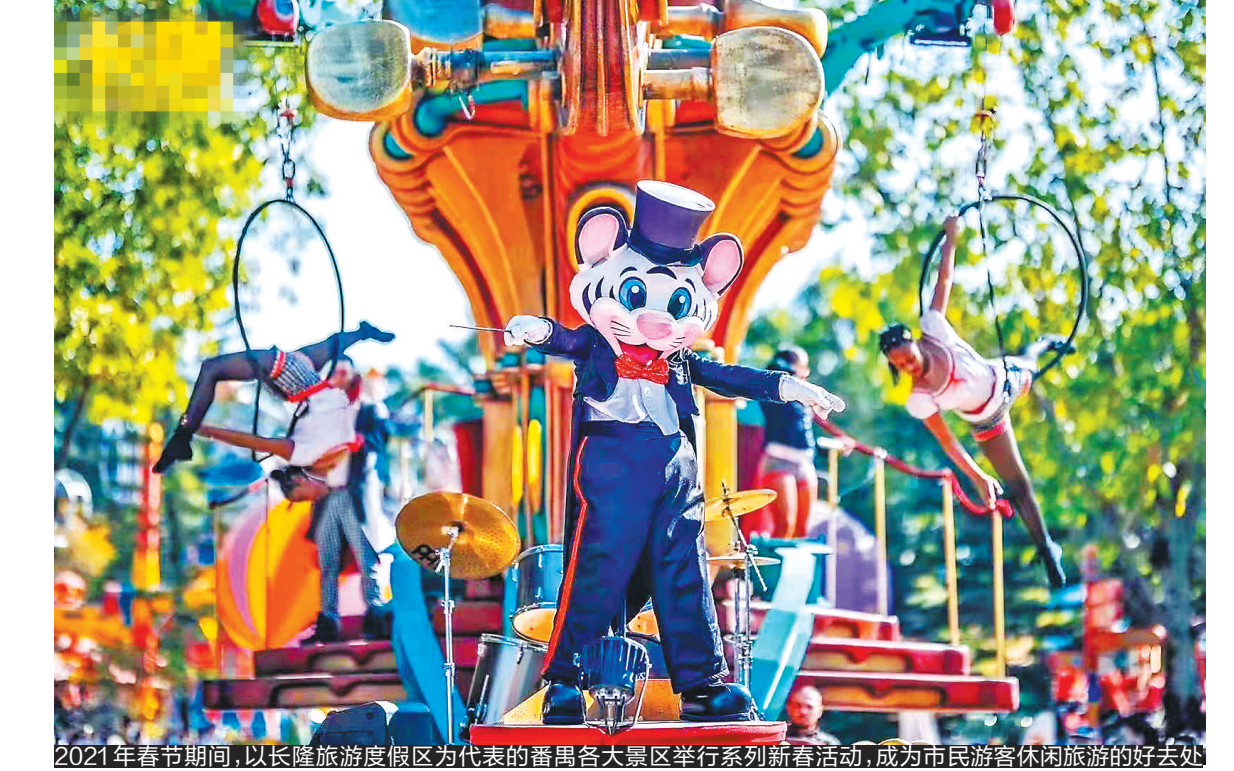
2021年春节期间,以长隆旅游度假区为代表的番禺各大景区举行系列新春活动,成为市民游客休闲旅游的好去处