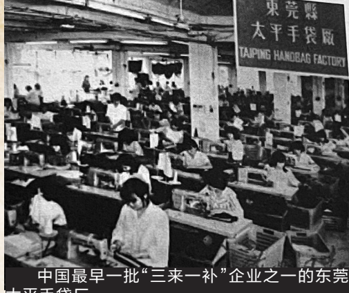
中国最早一批“三来一补”企业之一的东莞太平手袋厂

在大力发展“三来一补”(“来料加工”“来件装配”“来样加工”“补充贸易”的简称)中形成,带动珠江三角洲地区高速发展的独特发展模式,被中国泰斗级社会学家费孝通先生誉为“珠江模式”。本期《初心粤迹——中共广东百年史话》为您讲述“珠江模式”的故事。