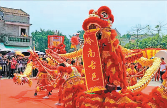
近年来,番禺区立足自身资源禀赋,策划了一系列民俗活动

设。并在广州南站设置旅游信息咨询中心,提供全域旅游服务。 此外,番禺区提前1年超额完成广州市“厕所革命”三年(2018-2020)行动计划的总任务,全区新建改建各类公厕261座。 针对缺乏高端品牌酒店的短板,近年来,番禺区还以引进高端品牌酒店来提升全域旅游品质。目前,万博商务区喜来登酒店已开业,希尔顿、艾美等高端品牌酒店正加快建设,广州南站商务区丽芮酒店已开始装修,万科翰逸酒店进入建设阶段。