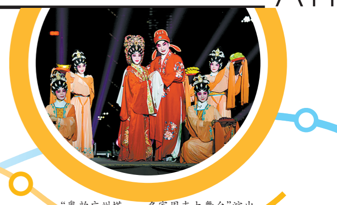
“粤韵广州塔——名家周末大舞台”演出