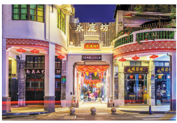
永庆坊已成为广州的名片

2020年，广州全市规模以上文化企业预计全年营业收入超过4000亿元。该数据的背后，凝聚了广州文化广电旅游系统人一年来的奋力拼搏。2020年疫情发生之初，广州在市层面成立了文化旅游防控组，制定印发15个工作指引，组织关停公共文化旅游场所，取消文化演出和展览活动，组织摸排从境外返回的旅游团组，妥善处置“世界梦号”邮轮疫情突发事件，协调设立首批定点接待酒店，全力做好涉外接待保障工作。转入常态化防控后，广州又严密组织文化旅游系统落实各项防控措施，做到科学、精准、有序。