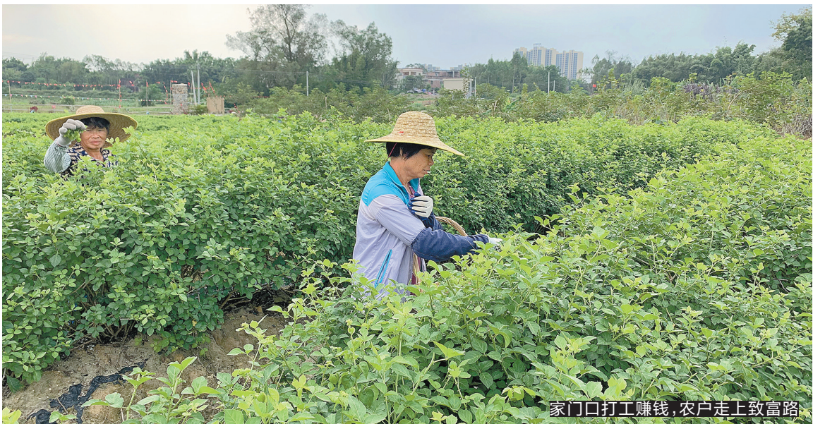
家门口打工赚钱,农户走上致富路

从“春种一粒粟、秋收万颗子”的粮食种植,到生产多个国家地理标志农产品,江门农村的产业与时代并进,成为农村脱贫、增收的“发动机”。日前发布的2021年中央一号文件,提出了全面推进乡村振兴、加快农业农村现代化。在此背景下,“十四五”时期江门将推动农村产业兴旺,巩固脱贫攻坚成果,接续乡村振兴,把江门的乡村造就成“聚宝盆”。