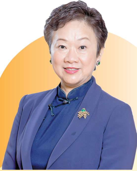
港区全国政协委员、全国政协提案委员会副主任王惠贞

可喜的是,目前,新冠肺炎的疫苗也到了香港,我们面对的困难是,如何才能尽早地让愿意打疫苗的人接种疫苗,这样才能尽快恢复市民生活。