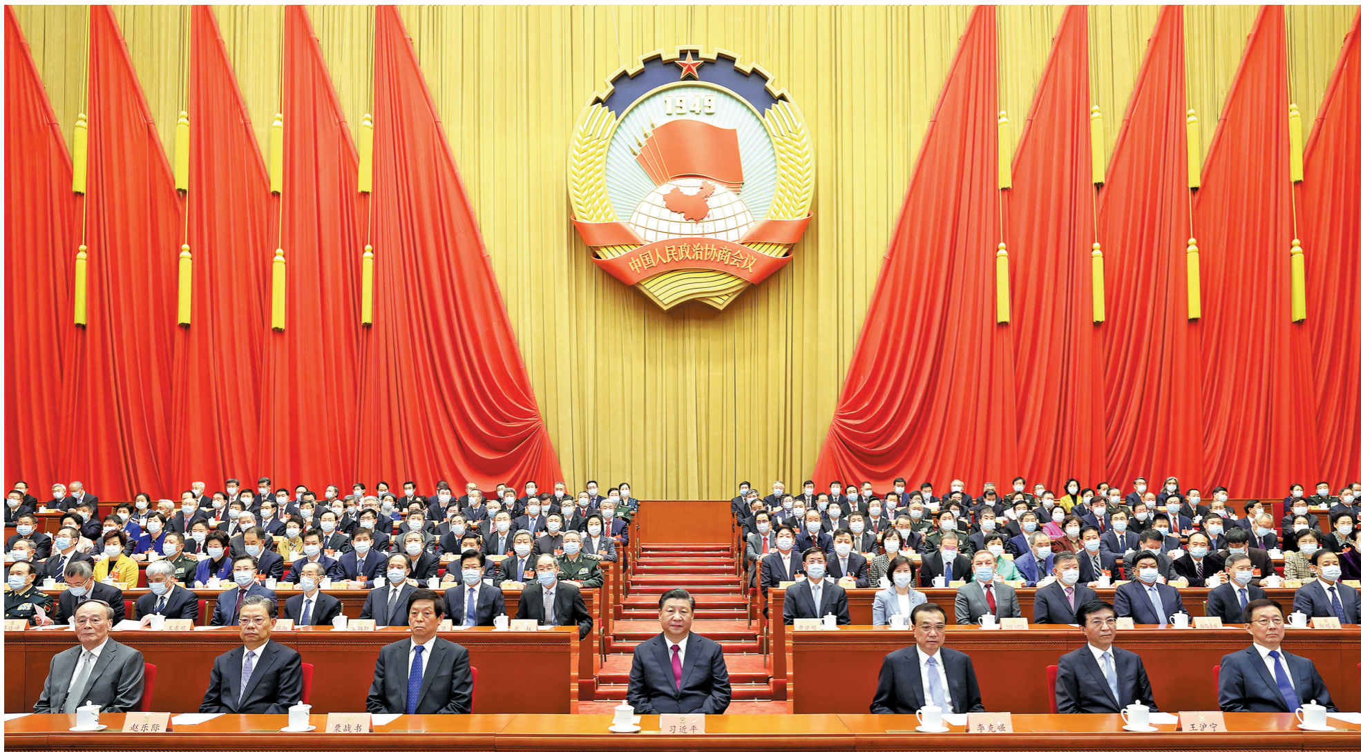
3月10日，全国政协十三届四次会议在京闭幕。习近平、李克强、栗战书、王沪宁、赵乐际、韩正、王岐山等在主席台就座

据新华社电 十三届全国人大四次会议11日上午举行代表小组会议，审议关于政府工作报告、“十四五”规划和2035年远景目标纲要、年度计划、年度预算、全国人大常委会工作报告、最高人民法院工作报告、最高人民检察院工作报告的七个决议草案；11时召开主席团第四次全体会议。11日下午，十三届全国人大四次会议在人民大会堂举行闭幕会。闭幕会后，国务院总理李克强将在人民大会堂三楼金色大厅出席记者会并回答中外记者提问。