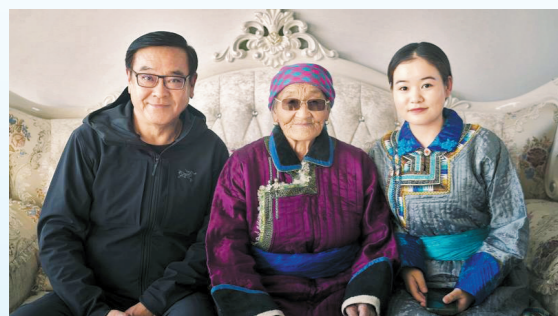
尔冬升在内蒙古古勒景

由尔冬升监制并导演的电影《父老》(暂定名)目前正在内蒙古绥远盟准格尔旗筹备,即将于今年4月开机。影片根据“三千孤儿入内蒙”的真实历史事件改编,全景式再现了60年前那一段永远镌刻在历史丰碑之上、流淌着民族大爱的共和国往事。尔冬升日前已于呼和浩特、锡林郭勒盟、乌拉盖草原及周地区勘景完毕,影片即将进入制作阶段。电影出品人、博纳影业董事长于冬表示,作为中国共产党建党一百周年的献礼影片,影片将于2021年内正式公映。