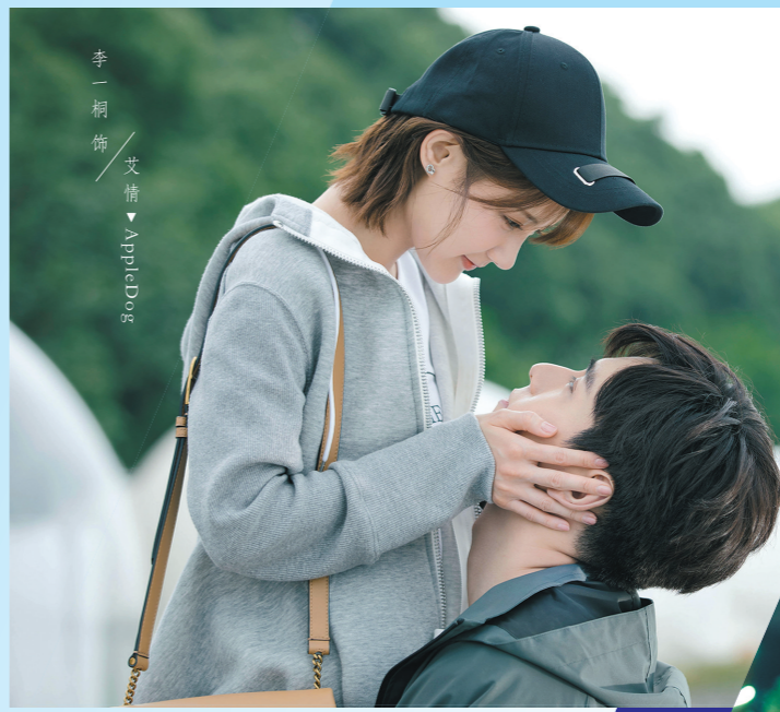
李一桐饰艾情/胡一天饰吴白

在2月、3月档期未有强力对手的情况下,截至羊城晚报记者发稿,据豆瓣数据显示,《时代》仅有“2.3万看过,6808人在看,9658人想看”,相比较《亲爱的》“34.3万人看过,3.4万人想看,1.6万人想看”的战绩,可谓断层式的差距。