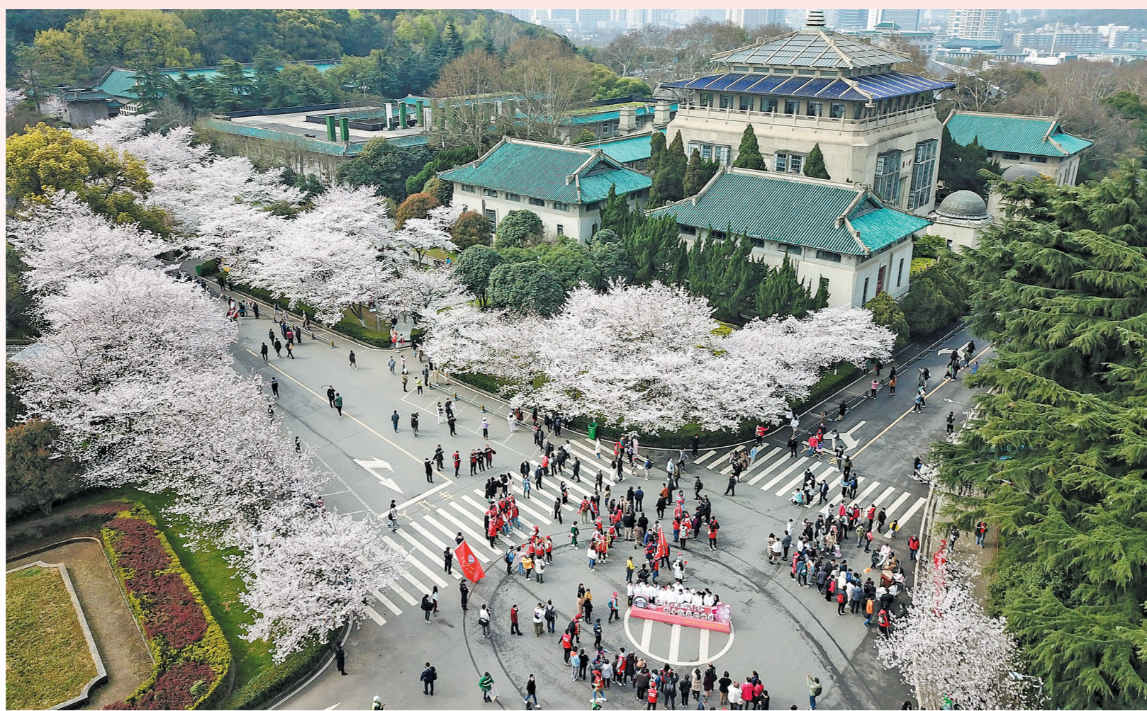
13日，来自全国各地的援鄂医护人员在武汉大学校园赏花

樱花树下，英雄归来。13日，武汉大学举办援鄂抗疫医护人员赏樱专场，来自全国各地援鄂抗疫医护人员及家属近1.2万人赴约赏樱。