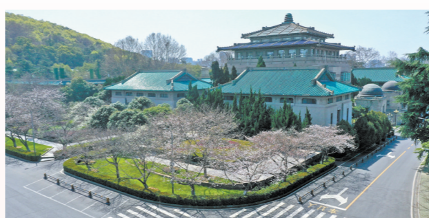
2020年春天，疫情中的武汉。武大樱花寂寞绽放