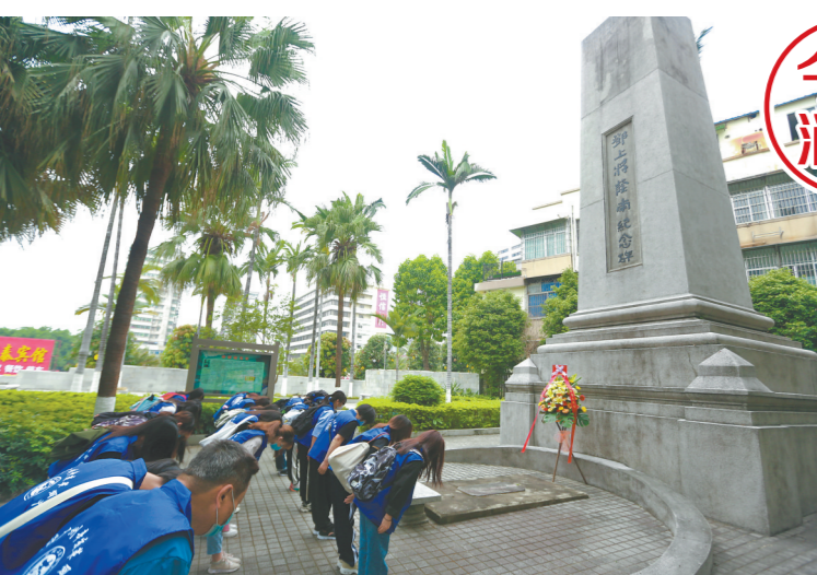
今天上午，广州志愿者为辛亥革命先辈扫墓

据悉，第五届“走读广州辛亥革命史”扫墓活动分成3条路线开展，依次是3月14日和3月28日先烈路线、3月21日越秀白云天河线以及3月22日银河园线，其中3月28日为广州市内党员专场，将另行招募参与人员。