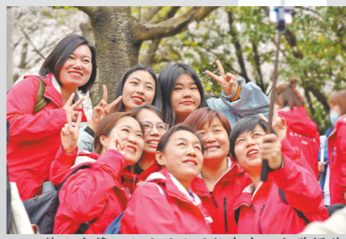
佛山市第二人民医院医护在武汉大学樱花树下合影留念 通讯员供图