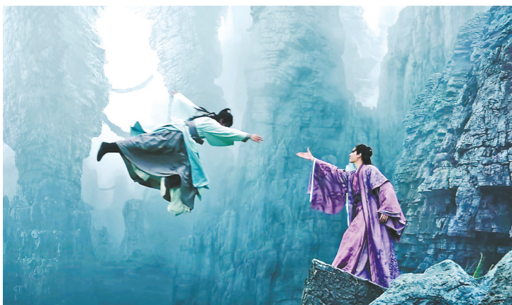
场景特效制作大气精美