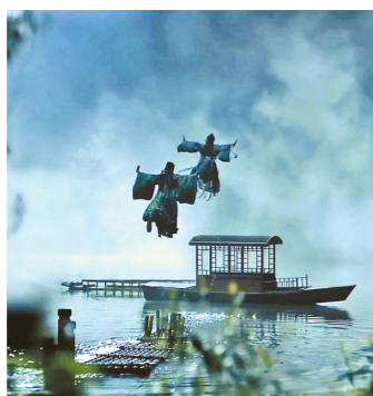
河上打斗有古典美学味道