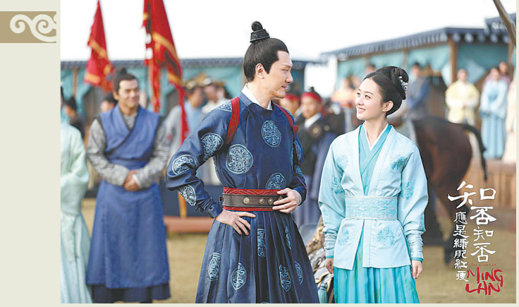
《知否知否应是绿肥红瘦》是宅斗剧经典

让人不适的还有剧中腐朽的婚恋形态。《锦心似玉》一面增加浓墨重彩的甜宠戏份，一边给男主人安排了妻妾成群的人设——在迎娶十一娘前，他已