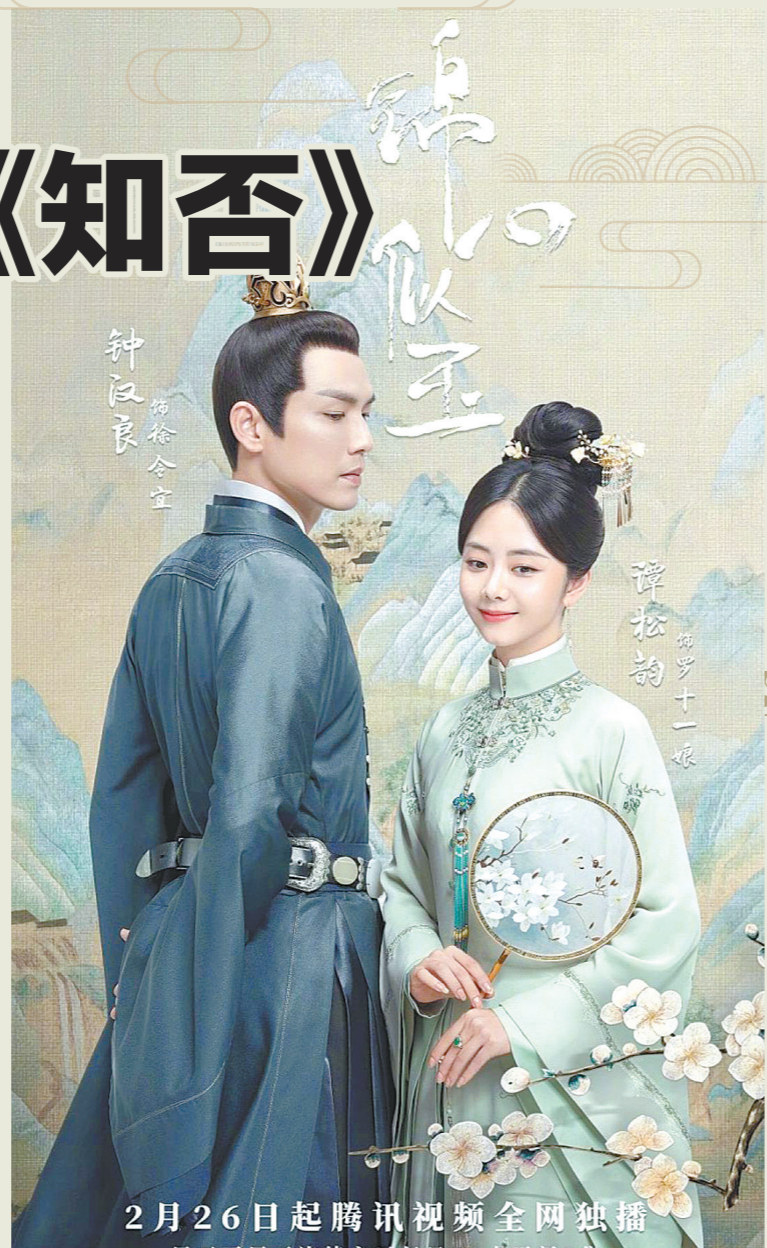
2月26日起腾讯视频全网独播

徐令宜对十一娘的单方向迷恋已十分明显，各种下马抱、公主抱、佯醉求关爱、花式维护……甚至明知对方拒绝也要赖在其房中睡暖阁。而日常在线“求圆房”，也成为该剧网络营销的重点。相比之下，《知否》则耐心讲述了男女主人公的各自成长之路，剧情播出过半后才开启婚后感情戏，克制“发糖”，让“搞事业”成为主线。 《锦心似玉》中的人物也缺乏成长性，男主角徐令宜一出场便是位高权重的侯爷，罗十一娘也是个能言善道的犀利女，甚至还具备高超的绣技和查案探案技巧。但《知否》中，女主角盛明兰却是从锋芒不显、明哲保身的乖乖女，一步步释放自己，最终成长为“为自己活一回”的独立女性；男主角顾廷烨则在经历了战场上刀光剑影的洗礼后，从流连勾栏瓦肆的离家浪荡子变成智勇双全的股肱之臣，人物成长性十足。