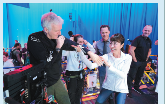
卡神与杨紫琼在《阿凡达2》片场

因为疫情影响以及卡神的高标准,续集的拍摄和制作进展缓慢。去年6月,《阿凡达2:水之道》曾一度在新西兰恢复拍摄,之后又再度停工。《阿凡达2:水之道》目前上映日期为2022年12月16日;《阿凡达3:带种者》将在2024年12月20日公映;《阿凡达4:祖古骑士》定档2026年12月18日;《阿凡达5:追寻伊娃》则将在2028年12月22日与观众见面。