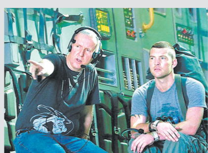
卡神(左)给演员说戏

国已有716家。总体来看,2010年国内全年新增影院313家,新增银幕数1533块,平均每天新增4.2块。在软硬件同时发力的情况下,中国电影的市场规模有了突破性的增长。2010年初,业界专家曾根据当时中国电影总票房每年约30%的增幅,预测当年总票房将突破80亿元,次年则突破100亿元,但因《阿凡达》的强势推动等原因,2010年总票房达到101.72亿元,“百亿大计”提前完成。如今,中国电影市场已成为全球翘楚:2019年,中国电影总票房达到642.66亿元;2020年在疫情影响下虽有半年“影院空窗期”,但仍以204.17亿元的总票房位列全球第一;2021年春节档,更创下超78亿元的惊人票房纪录。