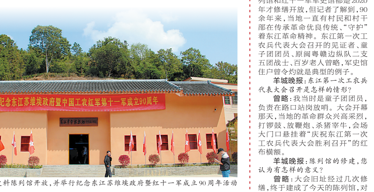
去年,东江革命根据地史料陈列馆开放,并举行纪念东江苏维埃政府暨红十一军成立90周年活动

巍八乡山,红旗猎猎扬。汽车沿着蜿蜒的道路向梅州市丰顺县八乡山镇滩良村行驶,红色标语和红军雕像随处可见,滩良村口广场“不忘初心,牢记使命”的刻字辉映着鲜红的党旗,村口的桥上一面面“中国工农红军第十一军”军旗迎风招展。距离村口几百米处,一座灰瓦黄墙的建筑出现在眼前,这就是修缮一新的“东江革命根据地史料陈列馆”。91年前,东江第一次工农兵代表大会在这里召开,选举产生了东江苏维埃政府,并成立中国工农红军第十一军,由此形成的东江革命根据地掀起了一波又一波革命高潮,筑起了中央苏区重要的西南屏障。烽烟散尽,岁月安好。如今,这座陈列馆向每一位到来的娓娓讲述那段峥嵘的革命故事。