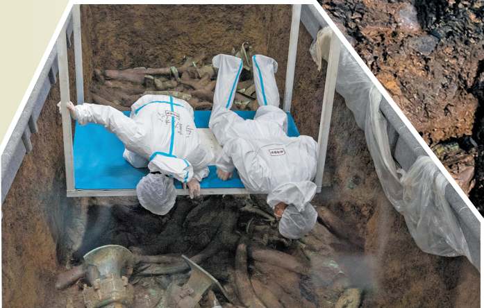
20日，考古人员在3号“祭祀坑”内工作