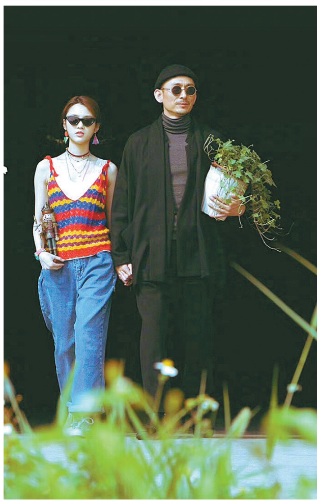
《日不落酒店》模仿《这个杀手不太冷》经典场面

票房虽低于重映的《阿凡达》和劲头十足的《你好，李焕英》，却仍以6635万元领先于其他三部新片《波斯语课》《21座桥》《又见奈良》。次日，该片被刘德华、肖央主演的“老片”《人潮汹涌》超越，在单日票房榜上滑一位。至上周日，该片更直接下落到榜单第8名，不但被《21座桥》《波斯语课》超过，还被两部“老片”《寻龙传说》《唐人街探案3》甩在了身后，当天票房仅有402.28万元。