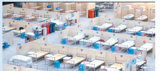
影片再现抗疫现场