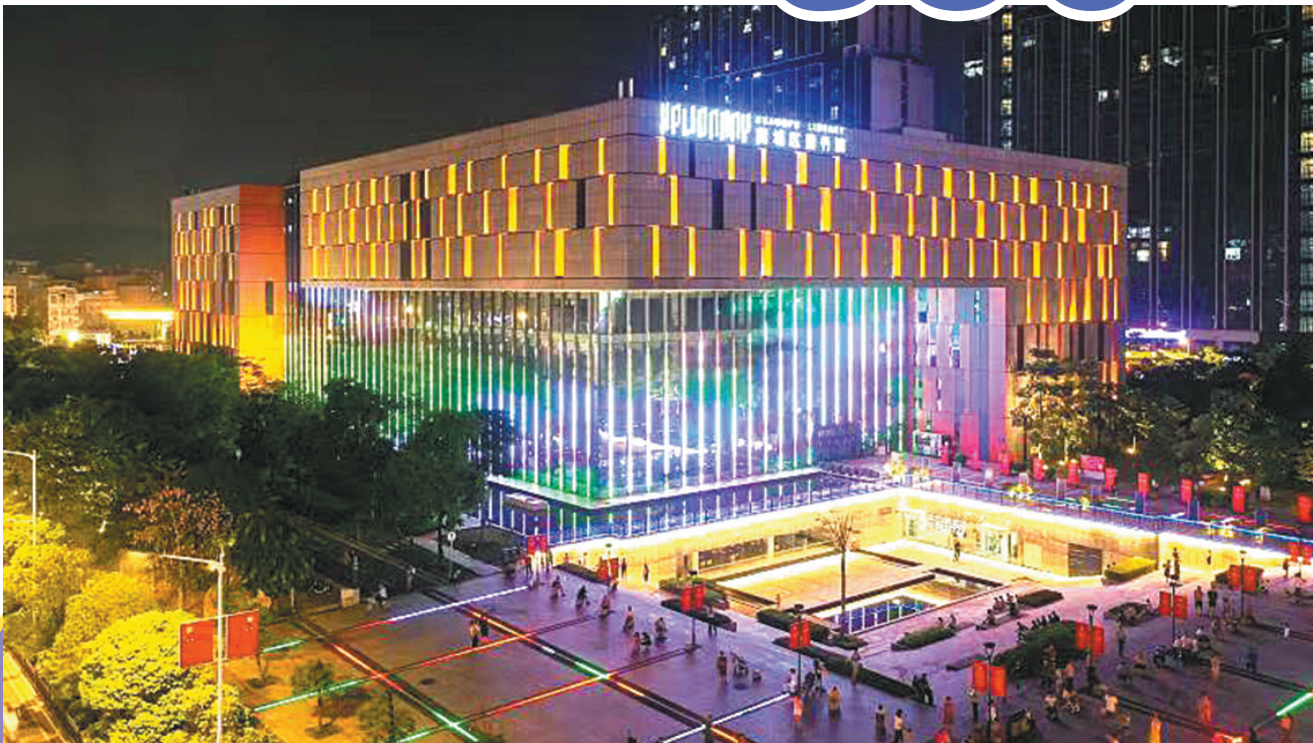
黄埔区图书馆 香雪馆夜景

“‘十四五’期间，广州还要加快公共文化体系数字化工程建设。”欧彩群说，构建标准统一、互联互通的广州文旅融合平台，实现横向汇聚图（图书馆）、文（文化馆）、博（博物馆）、美（美术馆）四类行业资源，纵向联通