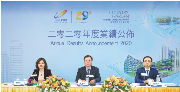
碧桂园管理层对未来充满信心