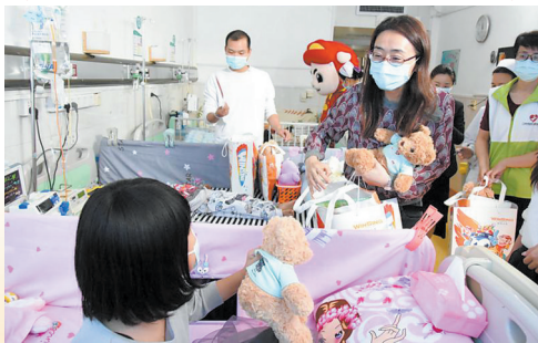
广州社会组织关爱特殊儿童