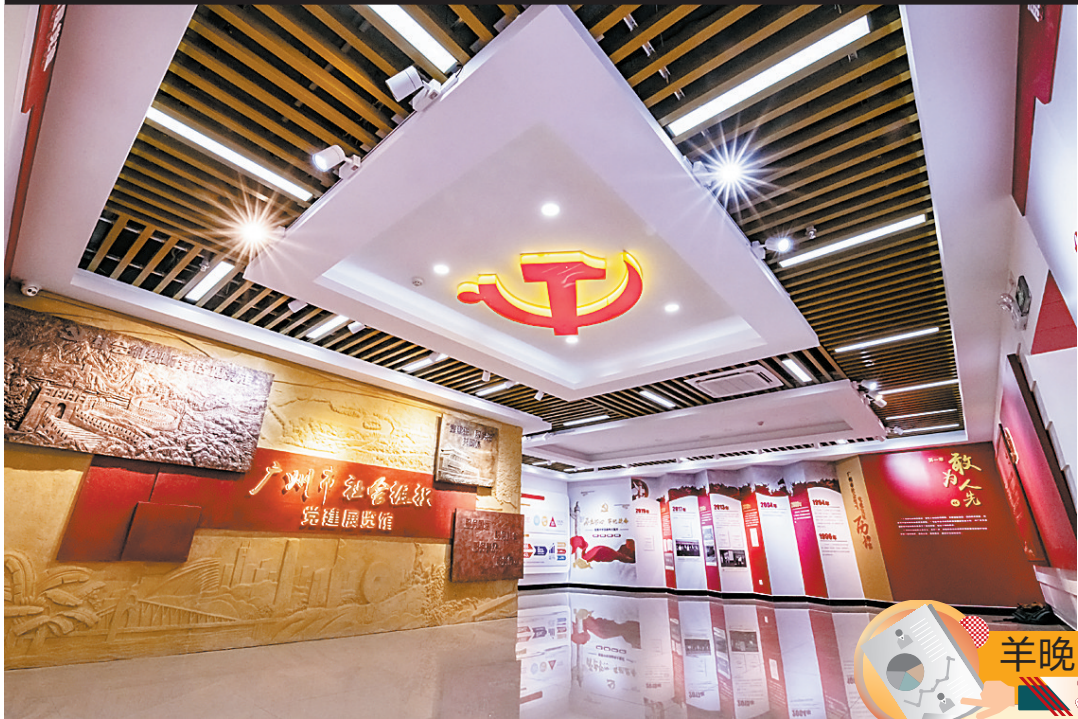
广州市社会组织党建展览馆

2020年全年,按目标市场分,碧桂园目标一二线与目标三四线销售金额比例为46:54。2020年,碧桂园进一步提升投资的精细化管理水平,通过精确监控每个特定城市四类库存、月均销售面积和平均开盘时间等指标,将目标城市或区域的供需情况按照库存短缺、库存合理、供应过量进行动态分类,并在此基础上对目标城市或区域做出积极进入、机会进入、暂不进入的投资决策。数据显示,公司目前已进驻的245个三四线城市中,84%的城市处于库存短缺或合理状态,可见公司布局市场需求潜力巨大。 碧桂园预计,在精准布局、土储丰富的支撑下,2021年新推权益货量约7000亿元以上,加上2020年12月底带人的约2600亿元货量,全年权益可售货量约9600亿元以上。全年可售资源充足,预计全年去化率不低于65%。