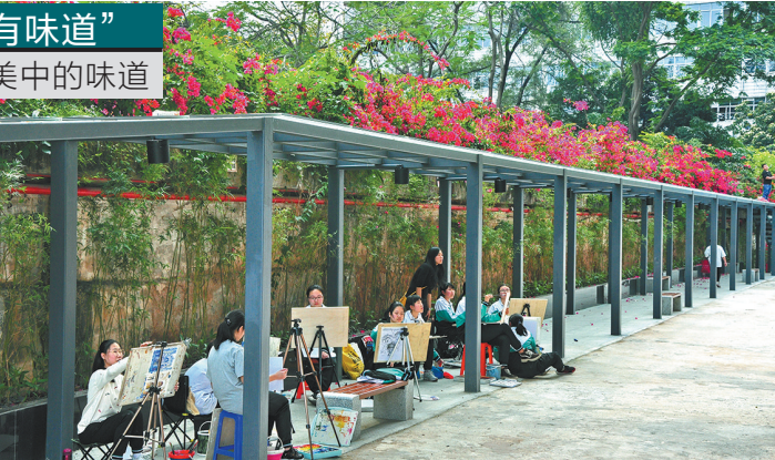
广州美中学生在风雨连廊作画