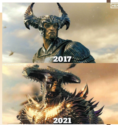
两版对比,荒原狼设计更有魄力

即便不考虑粉丝支持的光环,客观来说,《扎克·施奈德版正义联盟》也比“顺畅但肤浅”的院线版《正义联盟》要出色得多。影片除了画幅变成能展现更多画面细节的4:3之外,还加入了不少补拍镜头,但最多的变化还是来自重新剪辑,这让观众觉得整个故事焕然一新。对此,施奈德曾得意地表示:“电影中只有很少一部分是我新拍的,但观众会觉得有80%的桥段从未看过。”