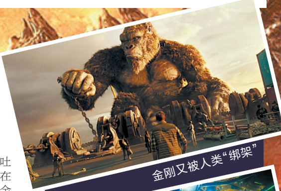
金刚又被人类“绑架”

不过,虽然《哥斯拉大战金刚》在宣传中把“谁能赢”作为卖点,但剧情中哥斯拉与金刚却并非真正的仇人,这两次对决更像是巨兽之间惺惺相惜的友好切磋。电影真正的压轴戏份其实是让哥斯拉与金刚联手对决大反派——由人类制造的机械哥斯拉。因此,哥斯拉和金刚到底谁更强,已经不那么重要了。