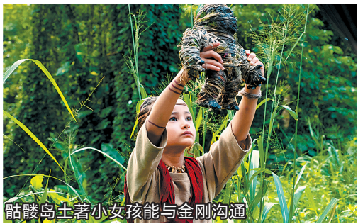
骷髅岛上,小女孩能与金刚沟通

哥斯拉与金刚这两位看似风马牛不相及的巨兽,为何会出现在同一部电影里?最现实的解释便是他们的版权刚好“在一起”:华纳兄弟与传奇影业力图打造“怪兽宇宙”系列电影,经过前三部《哥斯拉》《金刚:骷髅岛》和《哥斯拉2:怪兽之王》的铺垫,哥斯拉与金刚终于在第四部《哥斯拉大战金刚》里顺理成章地相遇。无论如何,这部电影起码满足了怪兽片爱好者的想象:当智商接近人类的“骷髅岛靓仔”金刚,对决能用“原子吐息”击穿地心的“上古神兽”哥斯拉,到底谁能赢得胜利?