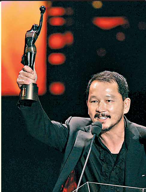
2009年,廖启智再度夺得金像奖“最佳男配角”

2月27日,中国香港演员吴孟达因肝癌去世,享年69岁。接连两位“最佳绿叶”的离开,令不少影迷感到伤感。有网友表示:“从小看智叔的戏,今天突然感觉童年结束了,希望我爱的演员们都能保重身体。”