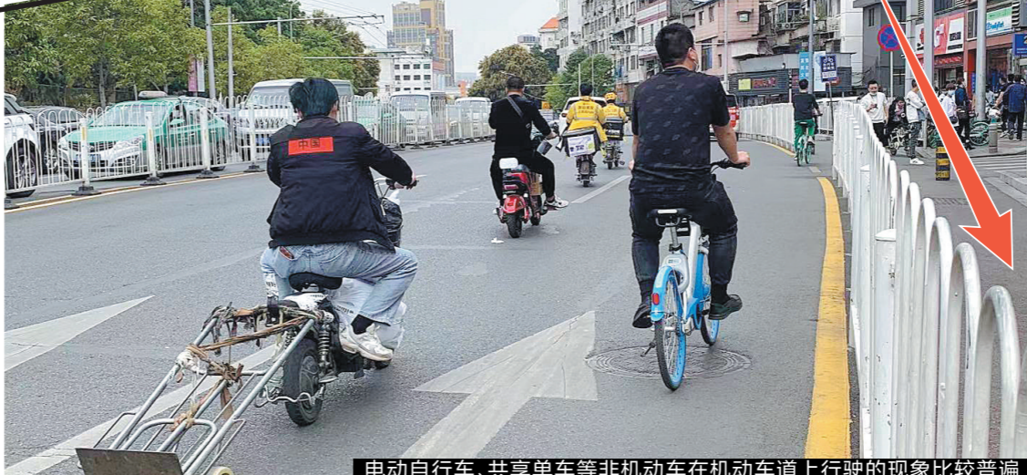
电动自行车、共享单车等非机动车在机动车道上行驶的现象比较普遍