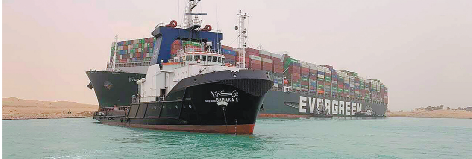
3月29日，“长赐号”货轮在埃及苏伊士运河搁浅近一周后终于脱困（见上图，图/人民视觉）。除拖船、清淤等人为救援努力，满月引发的更高水位海潮也助力货轮重新浮起并复航。