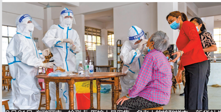
3月31日，在瑞丽市一检测点，医护人员采集一名老人的核酸样本

据新华社电 云南省德宏傣族景颇族自治州瑞丽市3月31日晚召开发布会介绍，3月8时起，瑞丽市对主城区开展全员核酸采样检测，截至31日20时，累计采集核酸样本20万7136份，目前采样工作仍在进行。