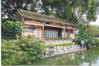
荔枝湾涌

位于荔湾老城区的荔枝湾涌迄今已有2000多年历史，有“小秦淮”之称，岭南水乡特色在此展露无遗。最好就是沿着河涌漫步，悠闲地欣赏周边的名胜古迹——荔枝湾涌、仁威庙、文塔、荔湾博物馆、蒋光鼐故居、小画舫斋、海山仙馆、陈廉伯故居、梁家祠、西关大屋历史街区……逛了便到著名的泮塘酒家或西关美食街泮塘路，吃一吃正宗的西关美食。