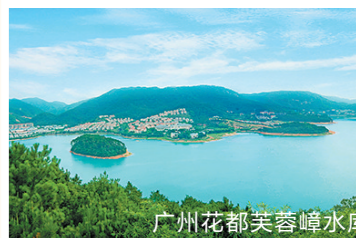
广州花都芙蓉嶂水库

广州市推进粤港澳大湾区建设领导小组日前正式印发《粤港澳大湾区北部生态文旅合作区建设方案》（以下简称《方案》）。《方案》将全面整合广州北（花都、从化、增城）和清远南（清城、清新、佛冈）生态、文化、旅游资源，挖掘粤港澳大湾区、泛珠三角、广东广清接合片区等多重政策优势，推动跨区域联合发展，并以“生态+农业+文化+旅游”为核心，打造国家城乡产业协同发展先行区。