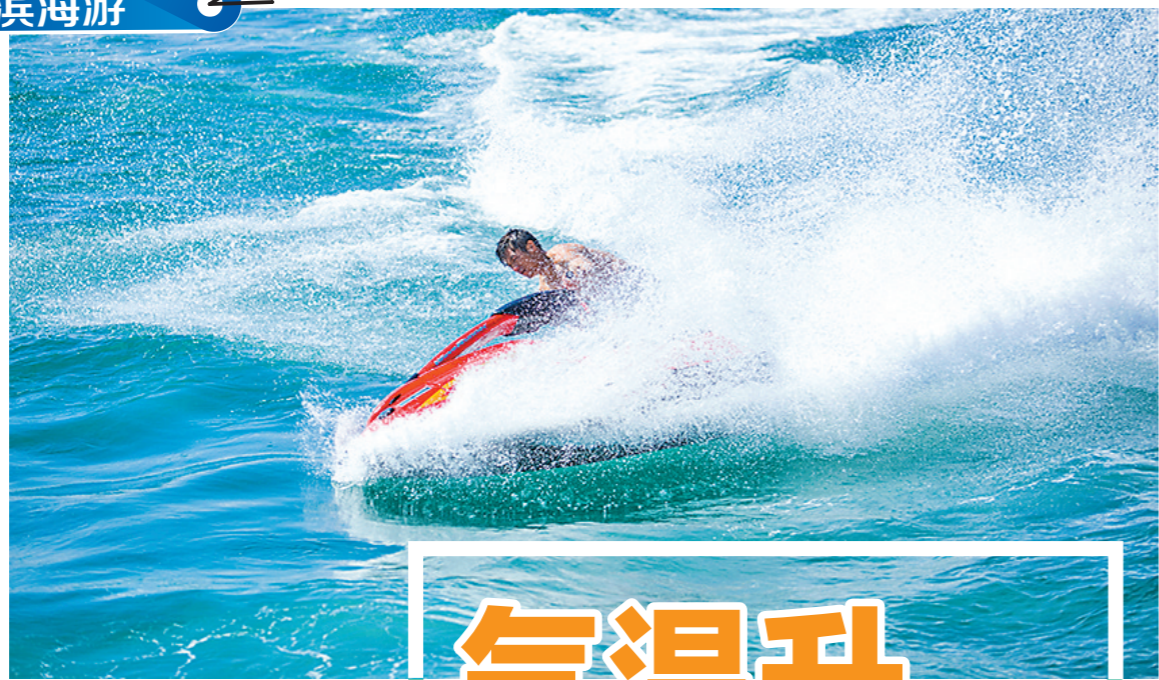
三亚水上运动吸引众多游客

据了解，三亚在今年夏天还将举行“三亚和平精英狂欢节”、海南国际潜水节、2021国潮古韵一座州古城文化节、中国大学生体育狂欢节暨CUFA总决赛、2021第三届屈回头情山国际啤