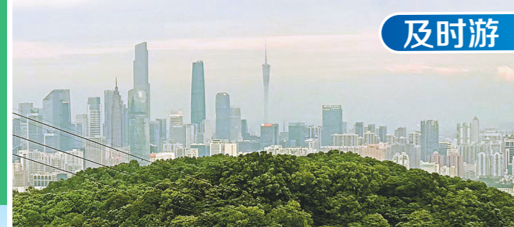
白云山上俯瞰广州市区