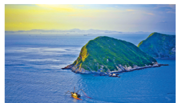
珠海万山群岛迷人风光(资料图)

酒节等节庆活动，打造市民乐于参与、游客乐于前来，具备社会效益和经济效益的主客共享的目的地活动。