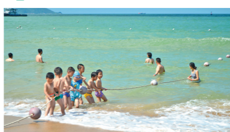
珠海东澳岛南沙湾，大人小孩一起玩水

由于近日持续的高温，广东多地仿似入夏。迫不及待到来的夏天，预示着2021年的滨海旅游旺季也会提前，地处南海之滨的海南以及广东沿海将成为旅游热点。无论是敏锐的旅行社，或者滨海旅游目的地城市，都开始行动起来，推出新的滨海旅游产品，让游客心动。