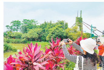
海珠湿地

处可见的百年古榕，枕河而居的村民，转角遇到的创意小店……小洲村的文艺气质，吸引了不同年龄的游客。对于想要不出广州寻找“鼓浪屿”一样的浪漫感觉的人来说，小洲村是不二之选。