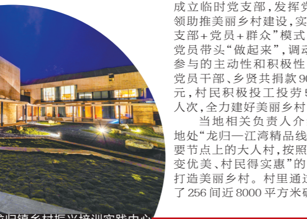
武江龙归镇乡村振兴培训实践中心

羊城晚报讯 记者5日从广东省公安厅获悉,清明节假期,全省公安机关执行高等级防控勤务,全力以赴做好各项安保工作。截至5日14时,全省110接报刑事治安警情比2019年清明假期下降28.34%;道路交通事故比2019年清明假期下降46.79%,各清明祭扫场所秩序良好,各主干公路交通总体顺畅。全省公安交警部门共查处和纠正各类交通违法行为9万余起,确保不发生因管理原因导致的长时间、大范围交通拥堵。(张瑞瑶 粤公宣)